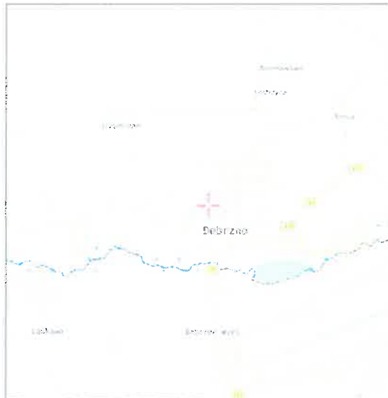
Rys. 1 Lokalizacja badanego obiektu