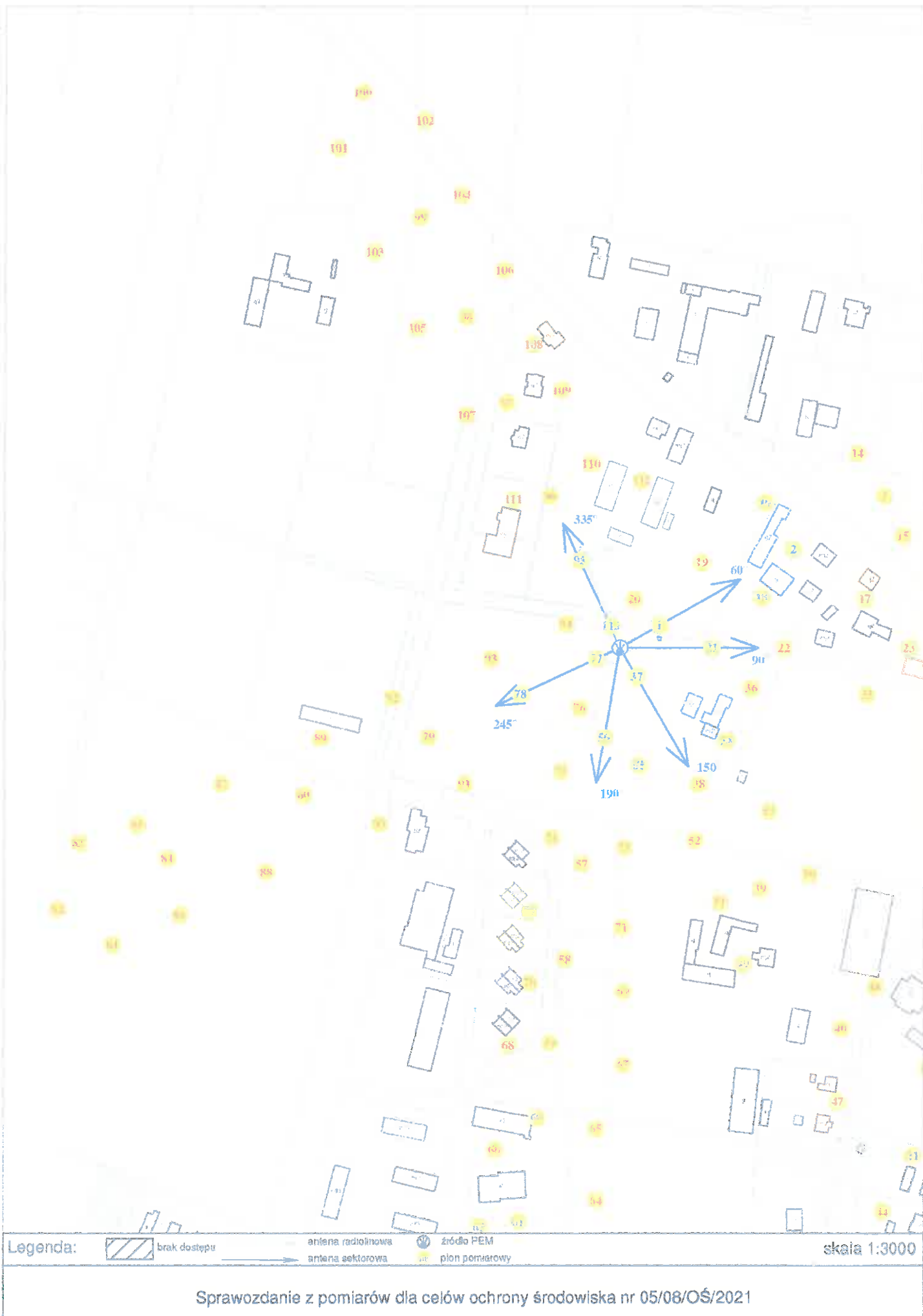
Rys. 3 Lokalizacja pionów pomiarowych